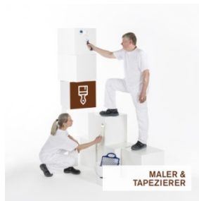
MALER & TAPEZIERER